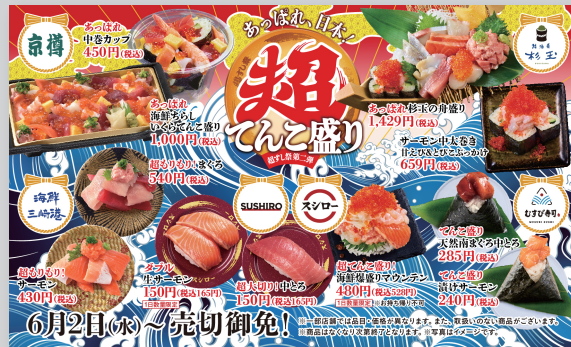
COMPANIESの創業祭として参加。各ブランドの販促メニューを販売し、ビルなどの看板広告や電車内の広告をジャックしました。