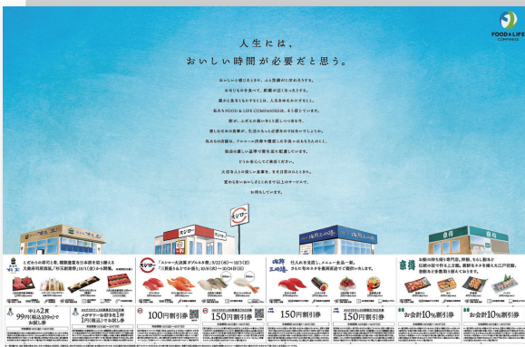
新聞見開き一面の広告に掲載されました。

杉玉はFOOD & LIFE COMPANIESの調達を活かし、同一食材を使用することが可能なため、COMPANIES全体の販促や広告にも掲載されます。また、COMPANIESが手掛けるブランドとして唯一フランチャイズ展開を行っており、業界からも注目されると同時に、COMPANIES内の広報を始めとするチームによる支援体制を築いています。